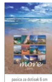
pasica za dotisak 6 cm

KALENDAR veliki dugi DK 7 listova (550x210mm) (izrada s logotipom tvrtke i podacima + kuverta)