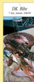
RIBE I RECEPTI