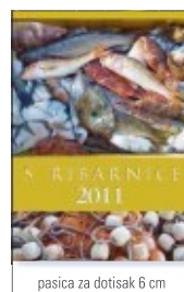
pasica za dotisak 6 cm